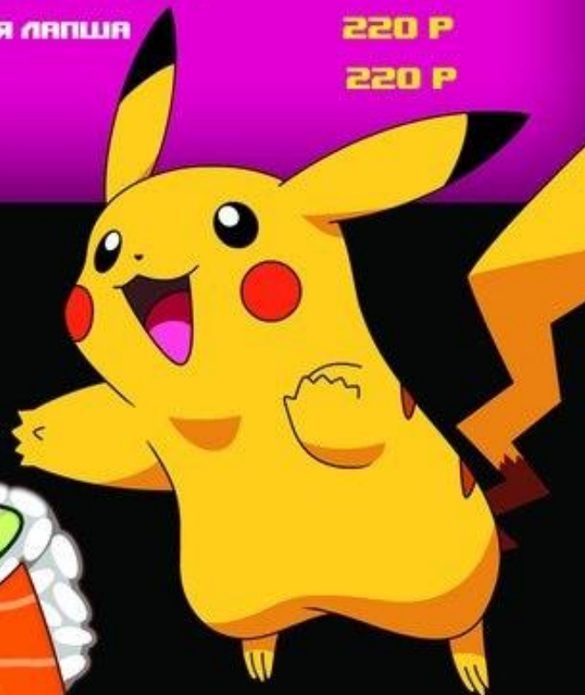
РИС 220 Р